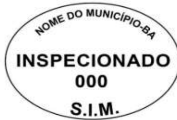
Modelo 2: 5x3cm